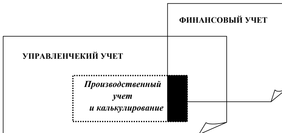
Рисунок 3 – Коммуникативно-конгруэнтное взаимодействие бухгалтерского финансового и управленческого учета расходов

Ниже приведены основные элементы учетной политики организации для целей бухгалтерского учета как инструмента управления расходами (табл. 1). Количество элементов в учетной политике в практической деятельности может меняться в зависимости от основного вида деятельности и организационной структуры организации.