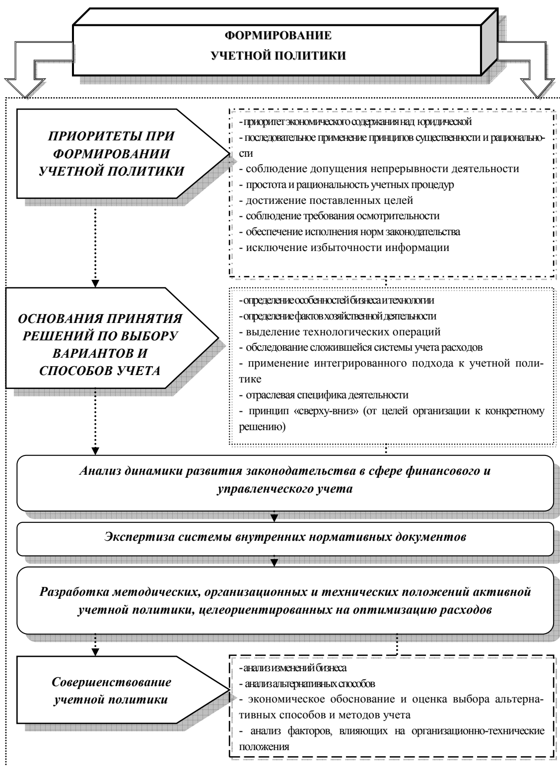
Рисунок 2 – Формирование учетной политики для целей управления расходами организаций элеваторного комплекса