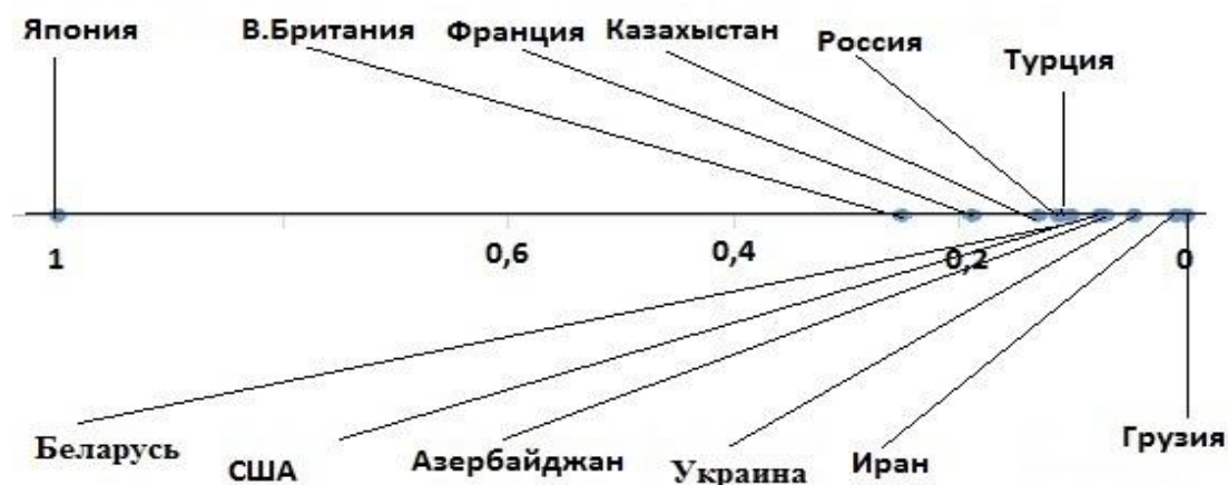
Рисунок 2 - Сравнение степени государственного вмешательства в некоторых странах на основе аграрных индексов (2011 год)

На рисунке 2 показано сравнительное состояние «аграрного коэффициента» в нескольких странах, рассчитанного на основе формулы: